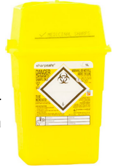
Mynd 3. Gult nálabox

Pegar gula nálaboxið er fullt er því lokað og farið með það í næsta apótek til förgunar.