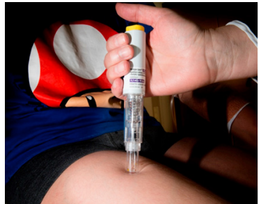
Mynd 2. Gjöf lyfs með sprautupenna