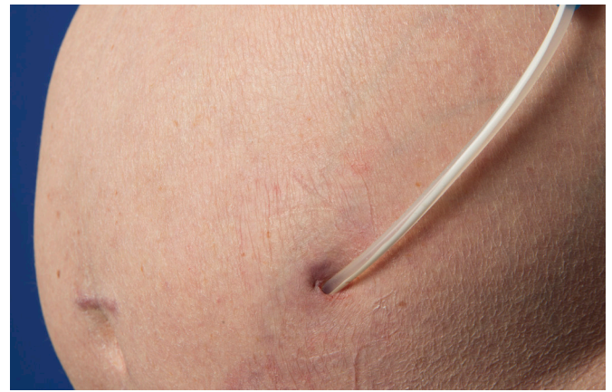
Svona á húðop að líta út.