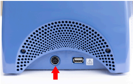
Mynd 3: Innstunga á tæki