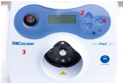
Mynd 6: Ljósabox, framhlið