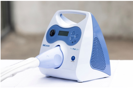
Mynd 1: Ljósbox