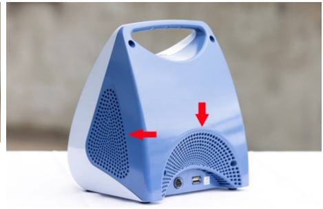
Mynd 2: Loftop á ljósboxi