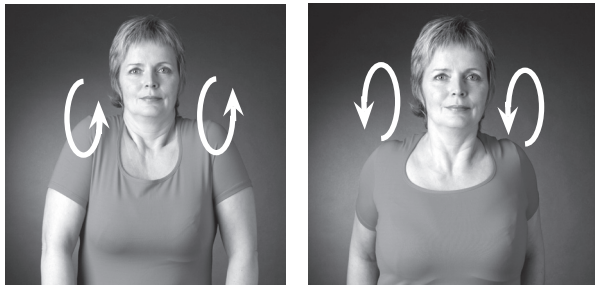
Gera hringhreyfingu með öxlum - upp, aftur, niður og fram