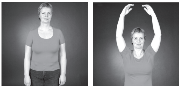
Lyfta handleggjum upp fyrir höfuð