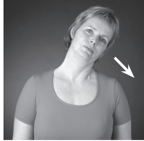
Halla höfðinu til hliðar