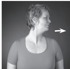
Snúa höfðinu til hliðar