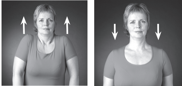
Lyfta og slaka á öxlum

Til að fyrirbyggja vöðvaverki í hálsi og herðum er ráðlagt að gera æfingar sem örva blóðrásina á þessu svæði. Hæfilegt er að gera 10-12 endurtekningar af hverri æfingu á dag.